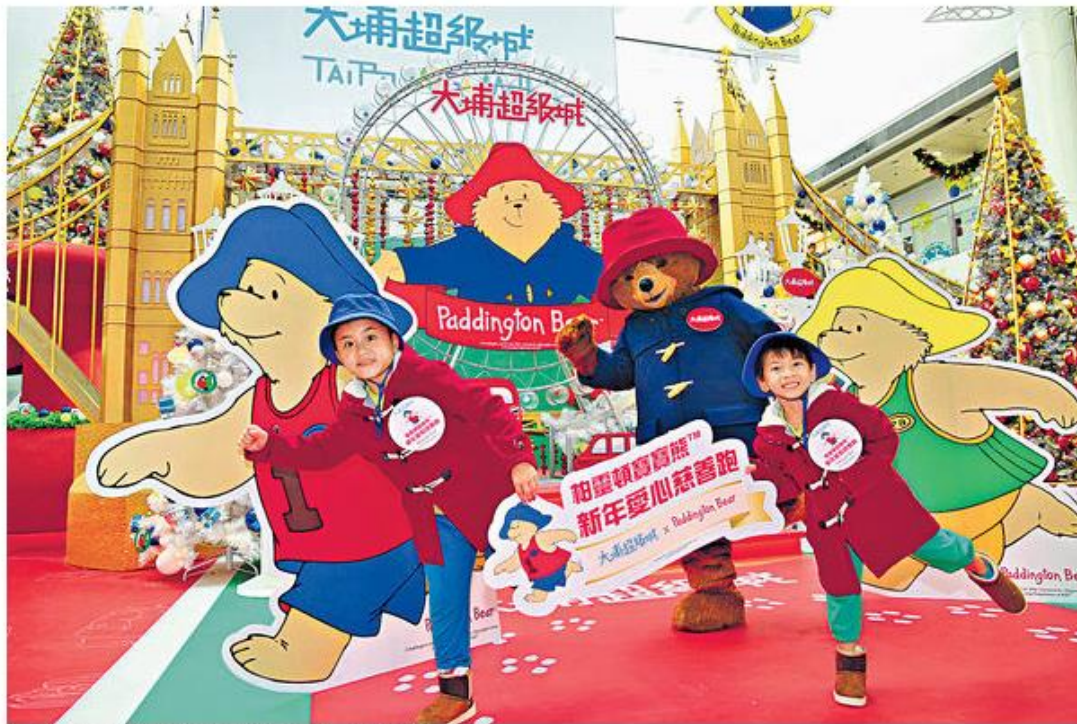
「柏靈頓寶寶熊新年愛心慈善跑」

【晴報專欄】柏靈頓寶寶熊係經典文學角色，故事中熊仔雖然經常「撞板」，但仍認真努力想做對每件事，令黛安聯想到唔少特殊學習需要 (SEN) 嘅同學仔，都好努力咁想挑戰自己能力。大埔超級城與大埔浸信會社會服務處合作，明年元旦舉行首屆「柏靈頓寶寶熊新年愛心慈善跑」，除遊走大埔著名地標，更有「體驗小任務」。比賽設公開組和親子組，分別最少捐款200元及100元便可參加，既可親子一番，又幫到SEN同學籌款，真係一舉兩得！