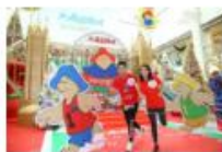
參加者要游走大埔著名地標尋找Check point，部分地點更有特殊學習需要體驗小任務。

官方網頁： http://www.tpbcss.org/Services/page-48.html