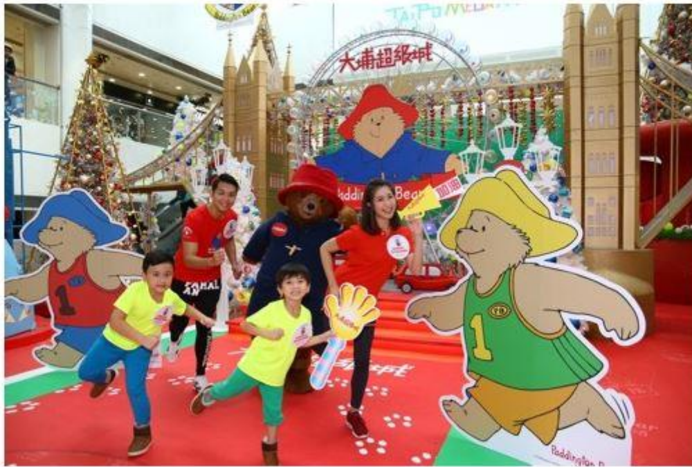
全港首屆「柏靈頓寶寶熊™新年愛心慈善跑」-親子組