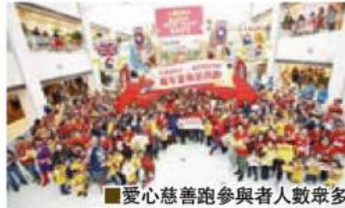
■ 愛心慈善跑參與者人數眾多