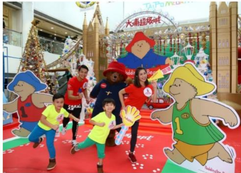
柏靈頓寶寶熊™新年愛心慈善跑分設親子組及公開組。