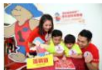
參加者要游走大埔著名地標尋找Check point，部分地點更有特殊學習需要體驗小任務。