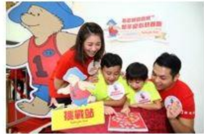
參加者需遊走大埔著名地標尋找檢查點 (check point)

官方網頁： http://www.tpbcss.org/Services/page-48.html