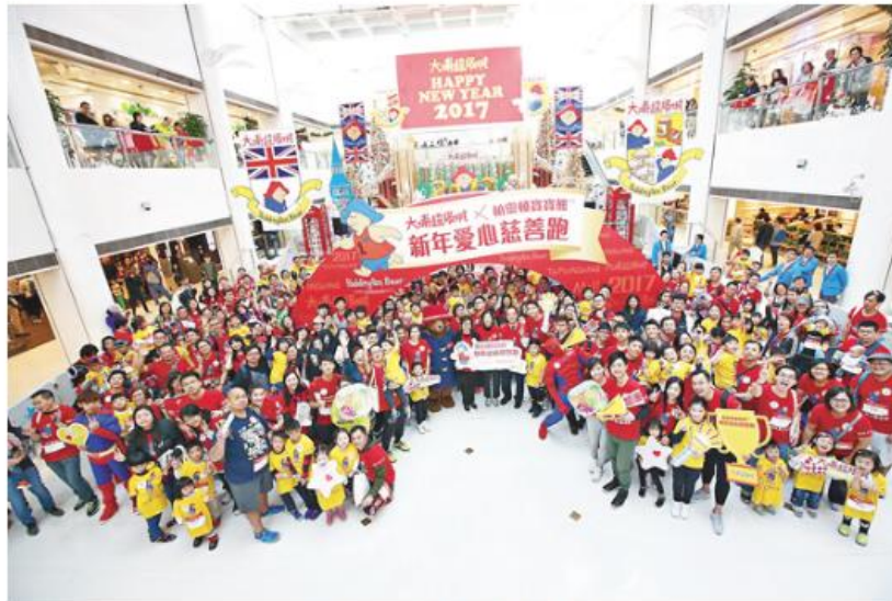
■愛心慈善跑參與者人數眾多