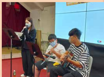
童 SEN 夏威夷小結他