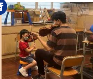
童 SEN 小提琴