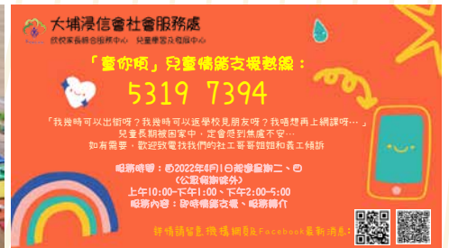
「童你傾」兒童情緒支援熱線