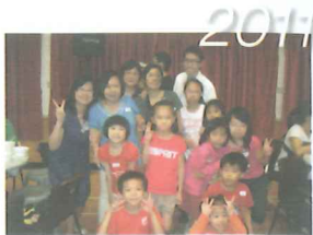
2011愛家氏學堂畢業禮