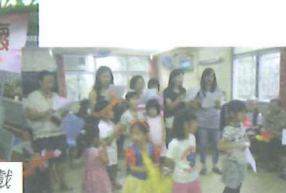
2012「社區關懷」攤位遊戲