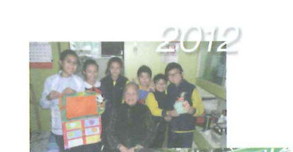
2011「村」流不息關愛大行動