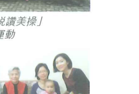
2012「埔浸橋」探訪獨居長者活動