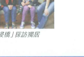
2012「埔浸橋」探訪獨居長者活動