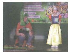
2006聯校親子 講故事比賽