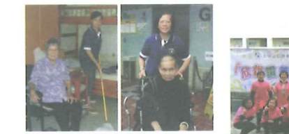
2012「埔浸橋」義工探訪安老院