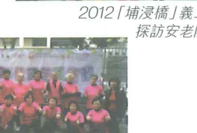
2012「欣悅讚美操」社區普及運動