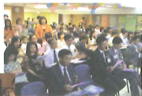
2004大埔浸信會 社會服務中心開幕禮