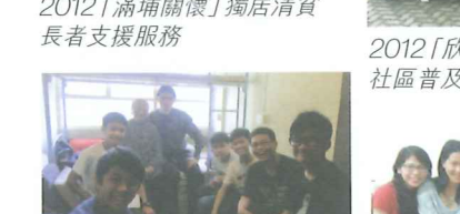
2012「滿埔關懷」獨居清貧長者支援服務