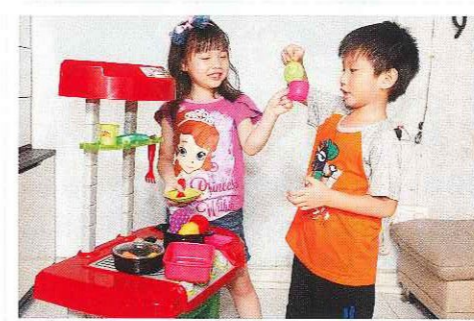
從假想遊戲中，小朋友會模仿扮演的角色，嘗試掌握和了解他人想法，有助心智發展。

其實，玩樂是沒有所謂的「指定時間」，但最好讓孩子每天都有至少1小時的玩樂時間；尤其是年紀越小的，所需要的遊戲時間會越多，只要家長能做好管理，小朋友自然能在學業與玩樂間取得平衡。隨着年紀漸長，家長便可適時放手，讓小朋友做好自律。另外，「空間」也是一個重要過程，讓小朋友有空閒時間做喜歡的事，包括玩樂，對他們的身心成長同樣十分重要。