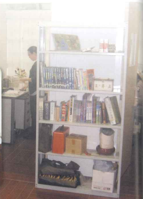
綜合中心教會辦公室