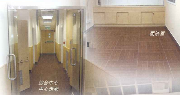
綜合中心 中心走廊