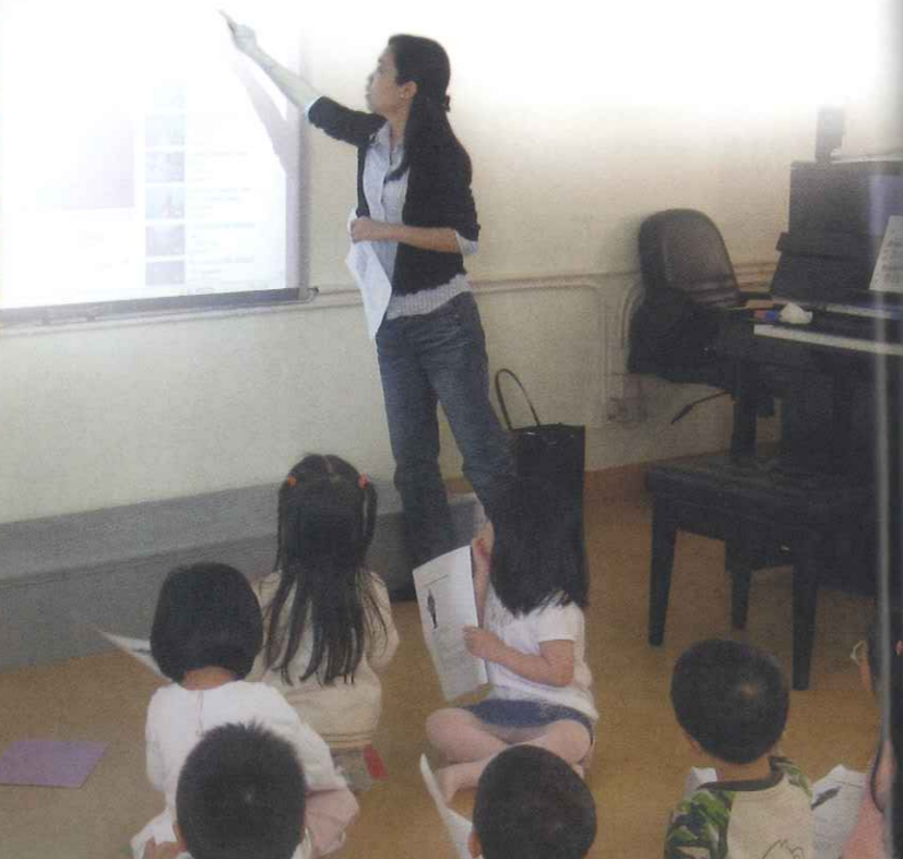
音樂藝術中心 合唱班

請弟兄姊妹繼續為CMAC祈禱，讓同工們繼續經歷神，克服一個一個的挑戰；又求主將更多孩子帶到音樂的天地，讓他們透過詠唱和多元化的學習活動感受神的榮美和實在。