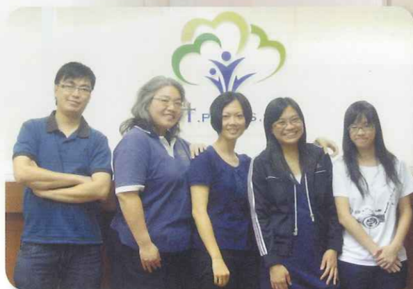
欣悅家長綜合服務中心團隊

感謝神，在2003年7月暑期活動開始時，本機構只有2名全職同工和1名兼職同工，以自負盈虧的方式運作。在神的眷祐下，在2010年5月時，機構已發展到有16名全職同工（其中有10位註冊社工），半職同工2位，兼職同工6位，義務同工3位，而機構恒常服務的人數就超過6000人（包括學校社工及各項校本計劃的服務範圍）。以上的發展，委員和同工們都沒有可誇的地方，我們只是流通的管子，以謙卑的心接受神對我們的託付，讓每一位服務受眾都能透過我們的服務接觸信仰，慢慢感受到神的愛，希望他們能體會回轉歸向神的喜悅。