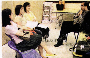
▲不少家長投訴外傭帶孩子愈帶愈不濟，大埔浸信會社會服務中心嘗試為有需要的家長舉辦針對性的講座。

*碰到孩子有能力完成的任務，外傭會否仍然主動向孩子提供協助？還是容許孩子有解決問題的時間和空間？