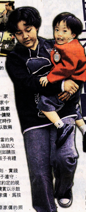
▶若家傭在協助家長照顧孩子上有困難，可參加一些相關工作坊，或替外傭報讀相關課程。

顧，以了解他們的管教態度是否平和而堅定，起居照顧有否妥善安排。惟家長需時刻留意家傭的管教概念，太鬆、太緊也不是好事，待他們能有效協助管教時，亦可下放權力；但要是外傭易於情緒波動及有過份的行徑時，父母便要收緊這些管教權力。